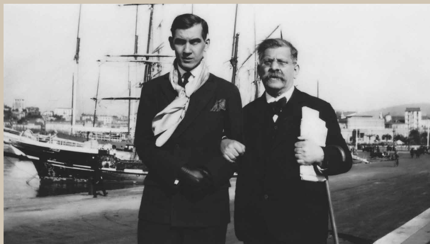
Magnus Hirschfeld et Karl Giese à Nice, début 1934.

Durant les premières semaines, Hirschfeld loge à l'Hôtel de la Méditerranée, 25 promenade des Anglais, dans une chambre avec vue sur « la beauté infinie de la mer ». À partir du 1er février, il loue, d'abord pour une année, un appartement quelques mètres plus loin, dans le Gloria Mansions au 63 promenade des Anglais. Situé au 5e étage, orienté au sud avec vue sur la mer, il se trouve vraisemblablement à l'extrémité ouest du bâtiment.