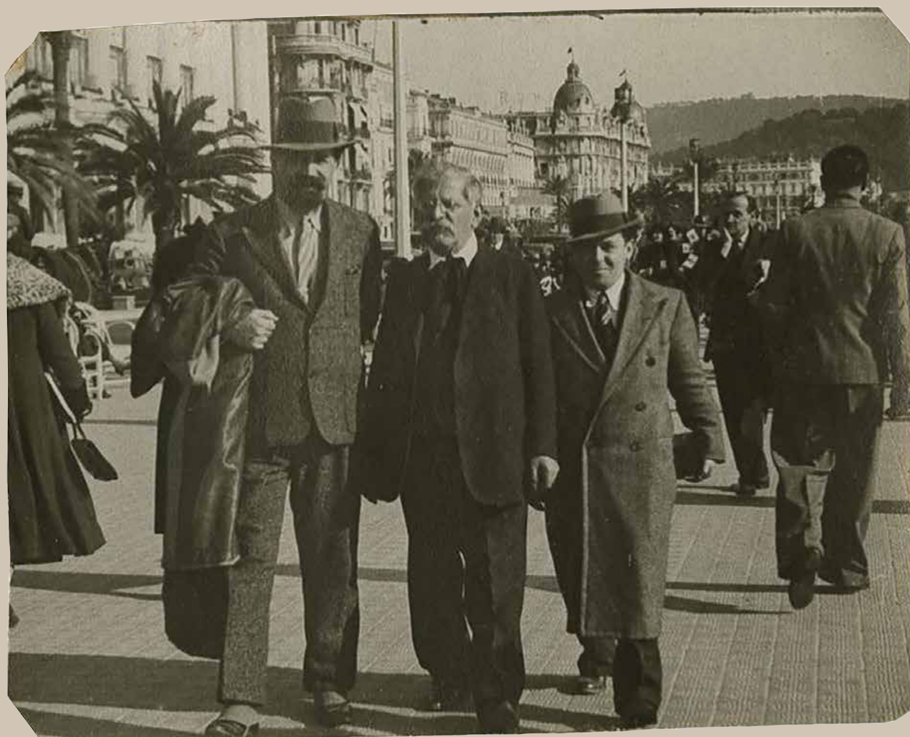
Magnus Hirschfeld et l'écrivain yiddish Zalman Shneour (à gauche) sur la promenade des Anglais, janvier 1935.

En revanche, il annule à la dernière minute un déplacement à Rome. Malgré sa carte d'identité française, il craint de ne pas pouvoir rentrer en France. « Dans les conditions et la situation actuelles, tout franchissement de frontière semble être un risque », écrit-il à un petit-neveu.